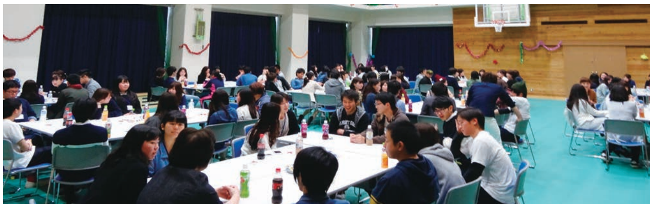
H28 年 4 月 全学年と教員揃っての交流会での様子より

ご指導いただいている方々をはじめ、地域の住民の方々の協力の上に教育が成り立っていることに感謝して、教職員全員で力を合わせ今後も頑張っていきたいと思います。